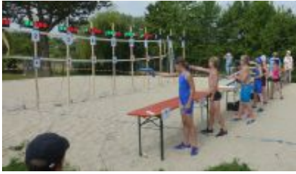
Die neue Schießanlage

Bei herrlichem Sommerwetter und mit toller Organisation wurden im Baden-Württembergischen Aalen die diesjährigen Biathle und Triathle-Meisterschaften ausgetragen.