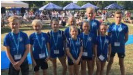
Das Team des Neusser Schwimmvereins